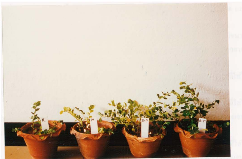
รูปภาพที่ 5 เปรียบเทียบถั่ววินคาเซีย ( Chamaecrista rotundifolia ) ที่ได้รับเชื้อไรโซเบียม และไมโคไรซ่า