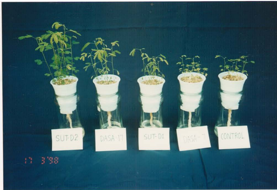
รูปถ่ายที่ 1 เปรียบเทียบประสิทธิภาพของเชื้อไรโซเบียมสายพันธุ์ต่าง ๆ กับ Desmanthus virgatus