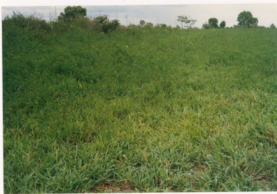
รูปภาพที่ 6 แปลงหญ้าที่ปลูกโดยไม่มีถั่วร่วมด้วย