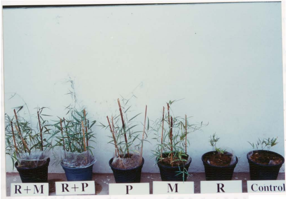
รูปภาพที่ 3 ภาพต้นถั่วเซนจูเรียนเมื่ออายุได้ 86 วัน