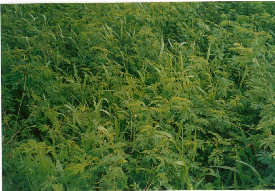
รูปที่ 7 หญ้าที่ปลูกร่วมกับไมยรา