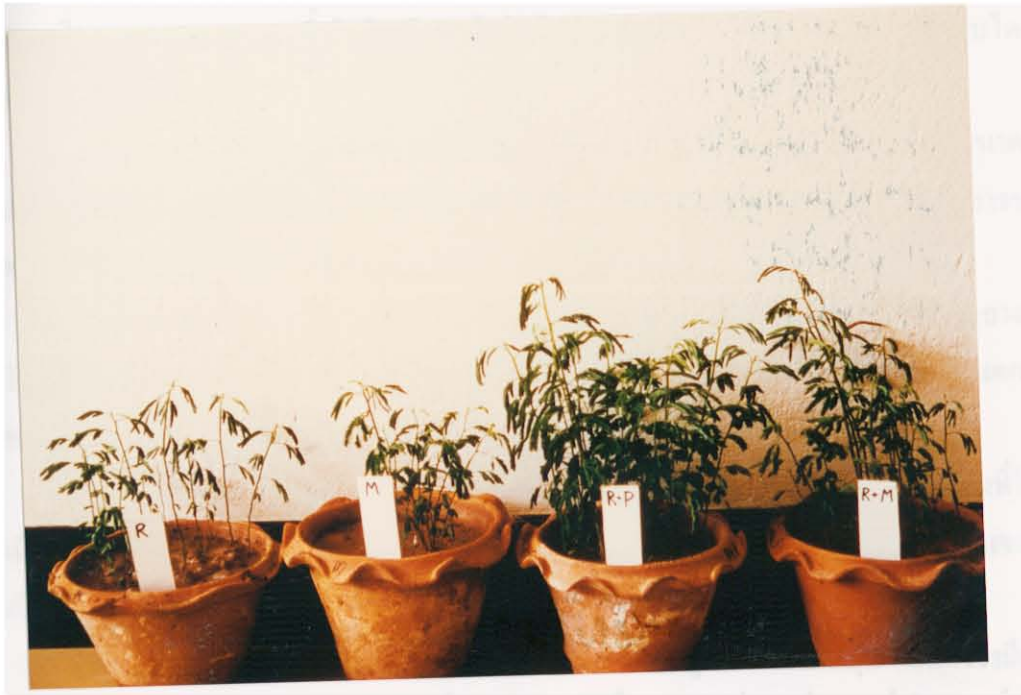
รูปภาพที่ 4 เปรียบเทียบไมยรา ( Desmanthus virgatus ) ที่ได้รับเชื้อไรโซเบียมและไมโคไรซ่า