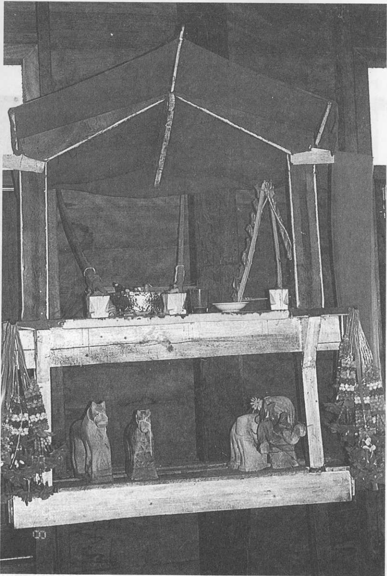
หิ้งผีพอนบ้านเจ้าก๊ก บ้านครसार อ.ปักธงชัย จ.นครราชสีมา