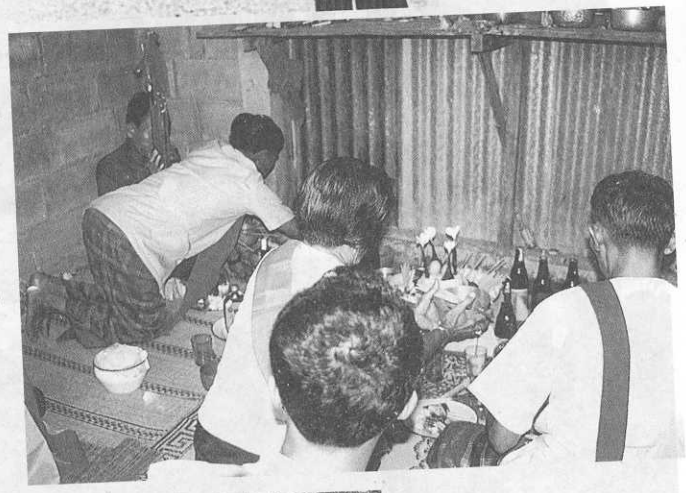
หมอแคน และ เครื่องบูชาใน ศาลเจ้าก๊ก บ้านโคกศิลา อ.ปักธงชัย จ.นครราชสีมา