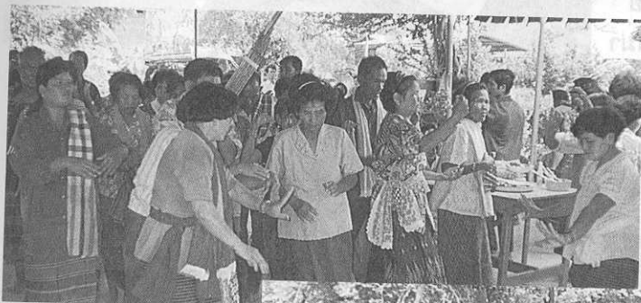
พิธีช่วงผีพ็อน บ้านดอนมะนาว อ.สีคิ้ว จ.นครราชสีมา