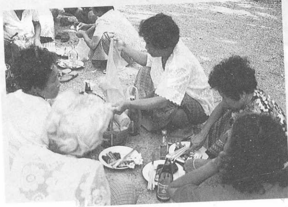
ลูกศิษย์เตรียมเครื่องบูชา หน้าศาลเจ้าก๊ก บ้านโคกศิลา อ.ปักธงชัย จ.นครราชสีมา