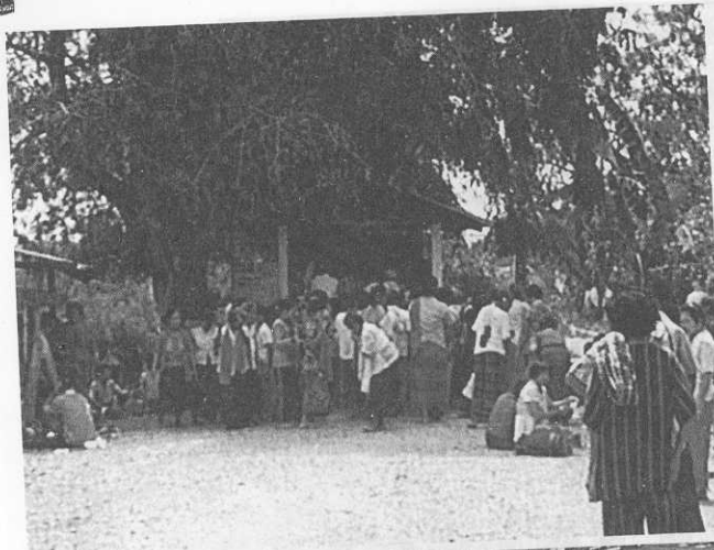
ลูกศิษย์เตรียมพ็อน ในช่วงผีพ็อน หน้าศาลเจ้าก๊ก บ้านโคกศิลา อ.ปักธงชัย จ.นครราชสีมา