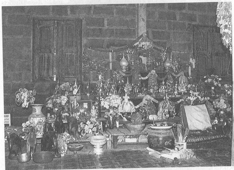
หิ้งพระพุทธรูป ของพ่อหลวงศักดิ์ดา เจ้าก๊ก บ้านหัวสระ อ.สีคิ้ว จ.นครราชสีมา