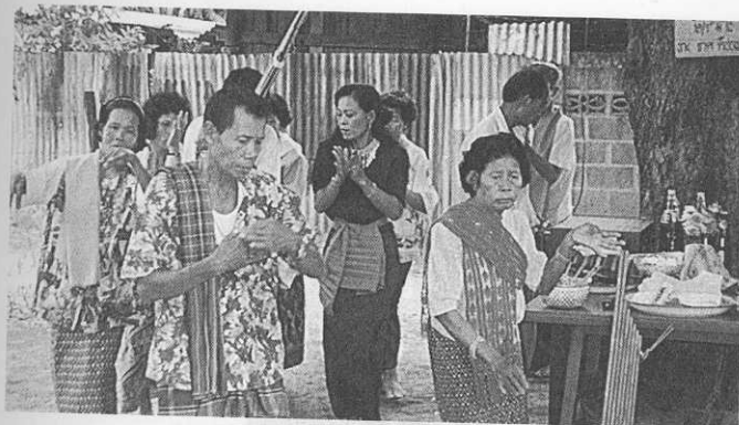
พิธี ช่วงผีพ็อน บ้านหัวสระ อ.สีคิ้ว จ.นครราชสีมา