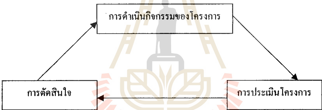
แผนภูมิที่ 2.1 แนวคิดพื้นฐานการประเมินของ สต๊ฟเฟิลบีม

สต๊ฟเฟิลบีม กล่าวว่า “การประเมินเป็นกระบวนการของการระบุหรือกำหนดข้อมูลที่ต้องการรวมทั้งการดำเนินการเก็บรวบรวม ข้อมูลและนำข้อมูลมาวิเคราะห์และสังเคราะห์ให้เกิดสารสนเทศที่มีประโยชน์ เพื่อนำเสนอสำหรับใช้เป็นทางเลือกในการตัดสินใจ” โดยมีแนวความคิดพื้นฐาน คือ