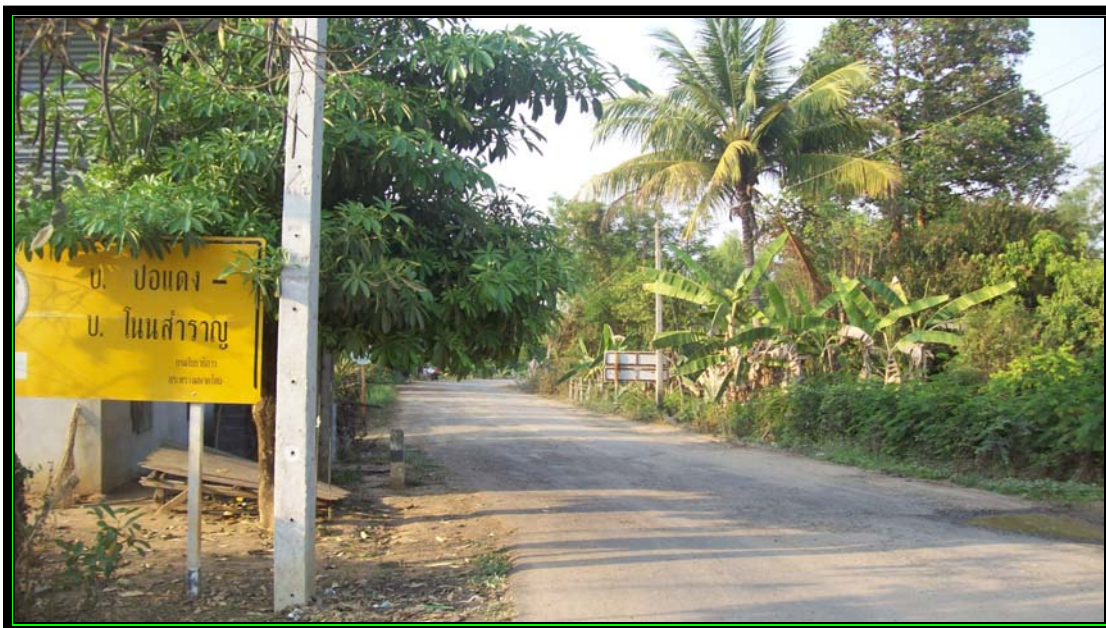
รูปที่ 2.4 สายที่ 3 คือ ถนนลาดยางสายบ้านปอแดง – บ้านโนนสำราญ - ตำบลคงพลอง