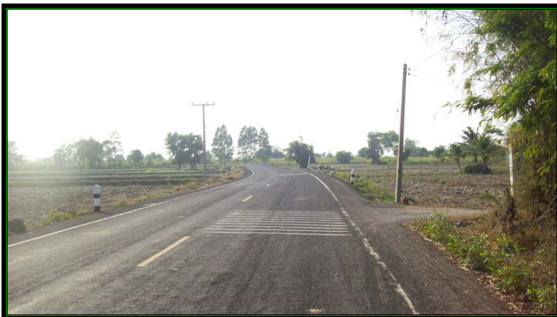
รูปที่ 2.5 สายที่ 4 คือ ถนนลาดยางสายบ้านวังน้ำใส – บ้านหนองหญ้าคา – ตำบลแคนคง