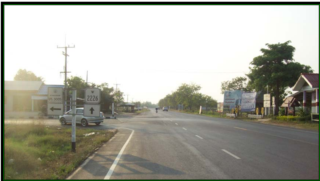
รูปที่ 2.2 สายที่ 1 คือ ถนนลาดยางสายสตึก-พิมาย-นครราชสีมา หมายเลข 2226