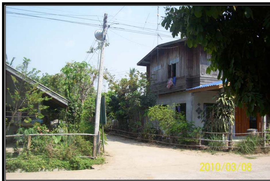
รูปที่ 4.5 ถนนลาดยางสายบ้านหัวฝาย - นาลาว หมายเลข 3005 ที่จะทำการติดตั้งคอมไฟฟ้า แสงสว่างสาธารณะ พร้อมสายอคูมิเนียม

เมื่อรวมทั้ง 3 รายการเป็นจำนวนเงินทั้งหมดดังนี้