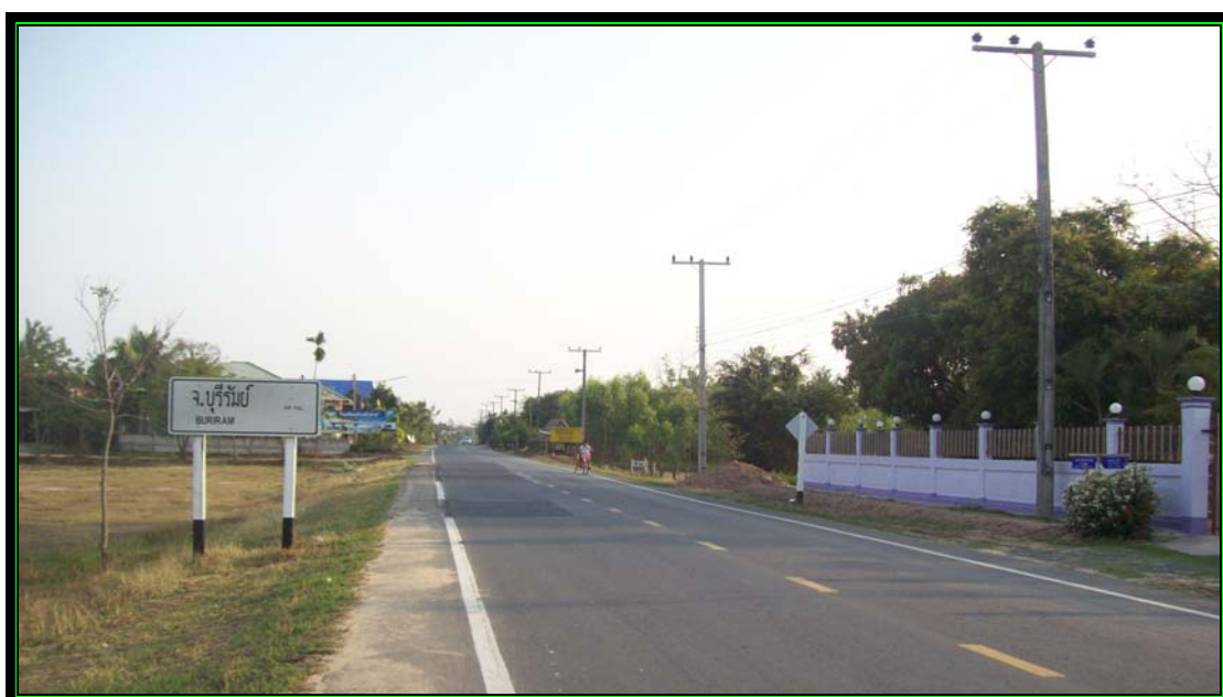
รูปที่ 2.3 สายที่ 2 คือ ถนนถนนลาดยางสายบ้านหัวฟาย - นาลาว หมายเลข 3005