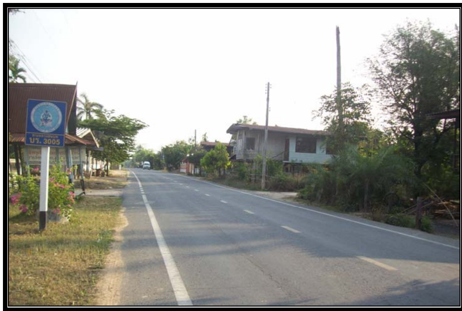
รูปที่ 4.1 ถนนถนนลาดยางสายบ้านหัวฝ้าย - นาลาว หมายเลข 3005 ที่ จะทำการติดตั้งเฉพาะ ดวงโคมไฟฟ้าแสงสว่างสาธารณะพร้อมพาดสายอลูมิเนียม