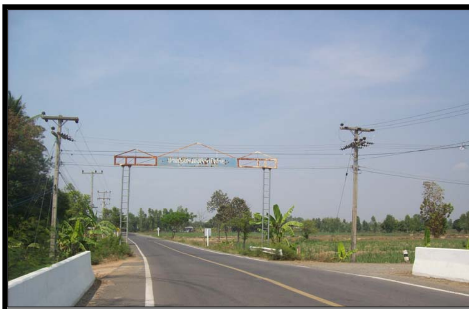
รูปที่ 4.3 ทางแยกจากถนนลาดยางสายบ้านห้วยฝ้าย - นาลาว หมายเลข 3005 ที่จะทำการติดตั้ง โคมไฟฟ้แสงสว่างสาธารณะ พร้อมสายอลูมิเนียม