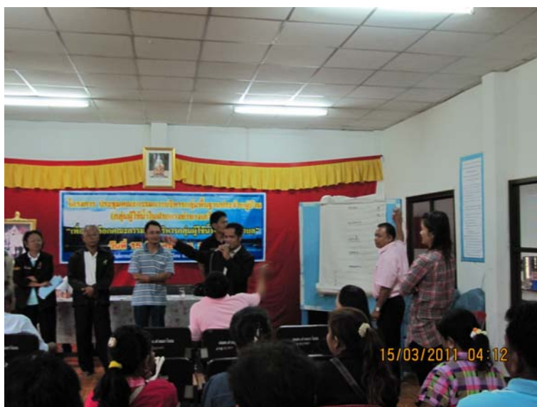
ภาพภาคผนวก ก-4 การประชุมประชาคมหมู่บ้าน เพื่อคัดเลือกคณะกรรมการกลุ่มผู้ใช้น้ำ ระดับหมู่บ้าน