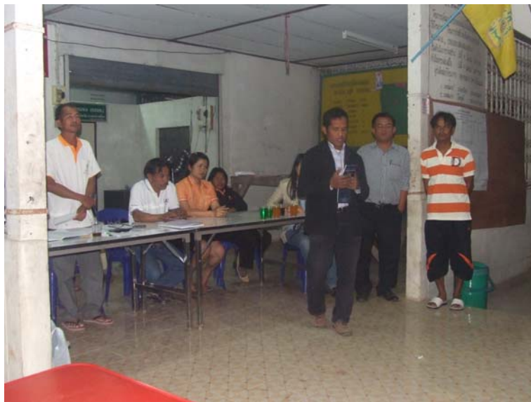
ภาพภาพนวก ก-2 (ต่อ) การประชุมประชาคมหมู่บ้านกระบวนการเรียนรู้และเผยแพร่ ความรู้เกี่ยวกับความจำเป็นในการบริหารจัดการน้ำ