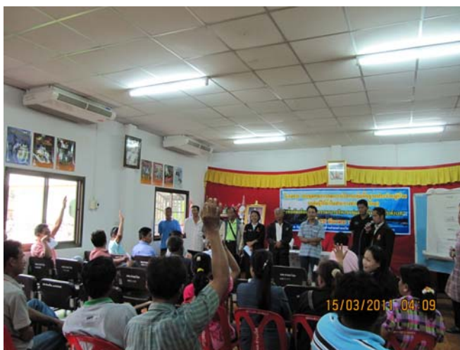
รูปที่ 7 การประชุมประชาคมคณะกรรมการกลุ่มผู้ใช้น้ำ กลุ่มพื้นฐานระดับหมู่บ้าน เพื่อทำการคัดเลือกคณะกรรมการกลุ่มผู้ใช้น้ำสำหรับโครงการฝายยางท่าทางเกวียน