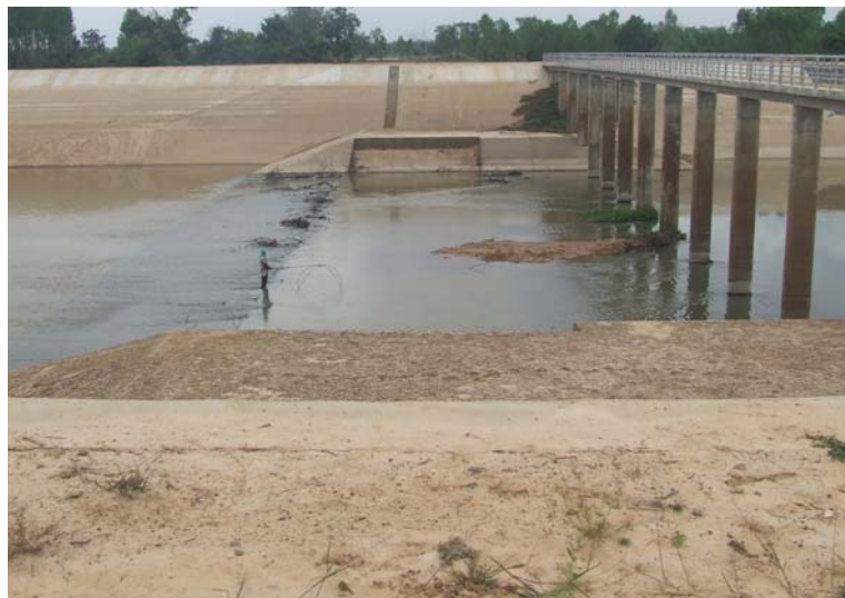
ภาพภาพผนวก ก-1 สภาพพื้นที่ตั้งโครงการก่อสร้างฝายทางเกวียน ณ วันที่ 30 มี.ค. 54