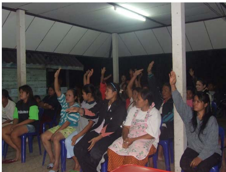
ภาพภาคผนวก ก-3 การประชุมประชาคมหมู่บ้าน เพื่อคัดเลือกคณะกรรมการกลุ่มผู้ใช้น้ำ ระดับหมู่บ้าน