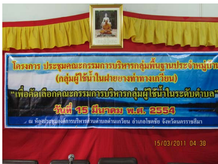
ภาพภาคผนวก ก-4 (ต่อ) การประชุมประชาคมหมู่บ้าน เพื่อคัดเลือกคณะกรรมการกลุ่ม ผู้ใช้น้ำ ระดับหมู่บ้าน