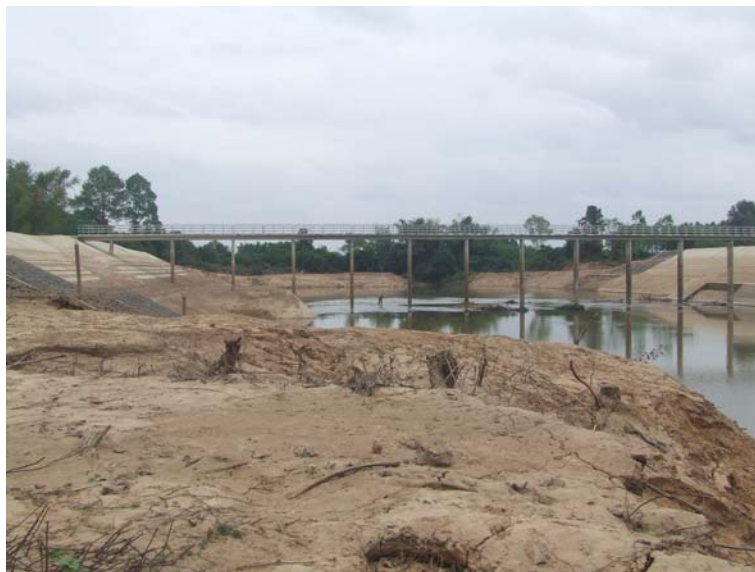
ภาพภาพผนวก ก-1 (ต่อ) สภาพพื้นที่ตั้งโครงการก่อสร้างฝายทางทำทางเกวียน ณ วันที่ 30 มี.ค. 54