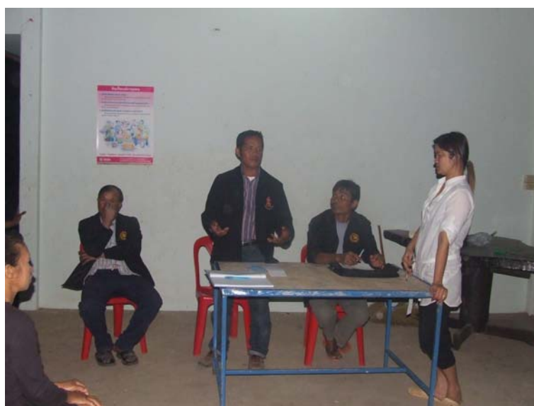
ภาพภาพผนวก ก-2 การประชุมประชาคมหมู่บ้านกระบวนการเรียนรู้และเผยแพร่ความรู้เกี่ยวกับความจำเป็นในการบริหารจัดการน้ำ