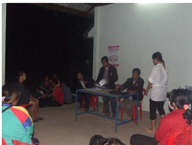
รูปที่ 5 การประชุมประชาคมกระบวนการเรียนรู้ และเผยแพร่ความรู้เกี่ยวกับความจำเป็นในการบริหารจัดการน้ำ