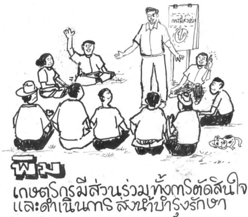
รูปที่ 3 : ตัวอย่างการประชุมผู้มีส่วนได้ส่วนเสียในการบริหารจัดการน้ำ