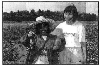
รูปที่ 2. ความภูมิใจของเกษตรกรที่ได้ผลผลิตสูงถึง 3.3 ตัน/ไร่ โดยไม่ใช้สารเคมี แต่ใช้สารล่อกลิ่นเพศเมียอย่างเดียวตลอดฤดูปลูก

มันเทศเป็นพืชเศรษฐกิจและเป็นพืชทดแทนข้าวหรือปลูกหลังข้าวในแผนพัฒนาเศรษฐกิจและสังคมฉบับที่ 7 และ 8 (สถาบันวิจัยพืชสวน, 2540) ผลผลิต 1-3 ตัน/ไร่ คิดเป็นมูลค่าเงิน 3,000-9,000 บาท จึงมีผลตอบสนองต่อเกษตรกรค่อนข้างสูง มีคุณค่าทางอาหารสูงกว่าข้าวเจ้า โดยเฉพาะ Vitamin A มีสูงถึง 7,100 IU/100 กรัม (กองโภชนาการ, 2530, ทวี ยาทุมมานนท์, 2523) ปัญหาที่สำคัญที่สุดของเกษตรกรคือ การเข้าทำลายของด้วงงวงมันเทศ ( Cylas formicarius L.) ในระยะลงหัว และรุนแรงในช่วงก่อนเก็บเกี่ยว ทำให้เนื้อหัวมันมีสีดำ หรือเขียวคล้ำ มีกลิ่นเหม็น และมีรสขม (Attajarusit, 2001) เกษตรกรประสบปัญหาการขาดทุน และต้องเลิกปลูก ในต่างประเทศมีการสกัดสารล่อกลิ่นเพศเมียเพื่อใช้ล่อเพศผู้ได้สำเร็จ (Lo et al, 1992, Heath et al, 1986, Mani and Nair, 1993, Pawar et al, 1993, Yasuda, 1995 และ Moriya, 1997) จึงได้นำมาทดลองใช้ร่วมกับวิธีการบริหารศัตรูพืช ที่ อ.บางปะหัน จ.พระนครศรีอยุธยา และประสบความสำเร็จอย่างยิ่ง (รูปที่ 1. และ 2.)