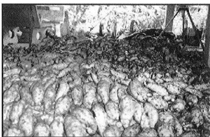
รูปที่ 1. หัวมันเทศจากการทดลองที่ไม่ถูกด้วงงวงทำลาย

ให้เลือกรากแปลงที่ไม่มีภาวะระบาดของด้วงงวงมาทำพันธุ์ ซึ่งใช้ส่วนยอด ยาว 30 ซม. (5 - 6 ข้อ) หากจำเป็นต้องใช้ยอดพันธุ์จากแปลงที่เคยมีการระบาดของด้วงงวงมันเทศ ก่อนปลูกให้จุ่มยอดมันทั้งมัด (500 ยอด) ลงในสารเคมีคลอไพริฟอส 40% อีซี อัตรา