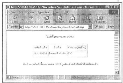
รูปที่ 3. หน้าจอของระบบสารสนเทศการจัดซื้อ

ระบบสารสนเทศการผลิต มีหน้าที่ในการประมวลผลและให้สารสนเทศเกี่ยวกับกิจกรรมต่างๆ ดังนี้คือ