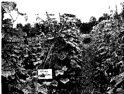
รูปที่ 3. เปรียบเทียบการใช้ปุ๋ยอินทรีย์ชีวภาพกับปุ๋ยหมัก

จากตารางที่ 2 เห็นได้ชัดเจนว่าปุ๋ยที่ผลิตมีคุณภาพสูงและสามารถให้ธาตุอาหารแก่พืชได้ดี เมื่อไม่ใส่ปุ๋ยคะน้ามีขนาดต้นเล็ก และผลผลิตต่ำที่สุด เมื่อใส่ปุ๋ยเคมีสูตร 15-15-15 อัตรา 30 กิโลกรัมต่อไร่ขนาดต้นคะน้าใหญ่ขึ้น และผลผลิตสูงขึ้นแต่ไม่แตกต่างกันมากนัก แสดงให้เห็นว่าปุ๋ยที่ให้ 30 กิโลกรัมต่อไร่ยังไม่พอ เมื่อใส่ปุ๋ยอินทรีย์ชีวภาพ 1000 กิโลกรัมต่อไร่ เห็นได้ชัดเจนว่าคะน้ามีขนาดต้นใหญ่มาก และผลผลิตสูงกว่ามากอย่างเห็นได้ชัดเจนเนื่องจากว่า ธาตุอาหารพืชในปุ๋ยมีปริมาณสูงกว่าปุ๋ยเคมีเมื่อใช้อัตรานี้ และข้อได้เปรียบของปุ๋ยอินทรีย์ชีวภาพอีกประการหนึ่งก็คือ ให้วัสดุอินทรีย์แก่ดินและธาตุอาหารที่เป็นอื่น ๆ ครบ รวมทั้งจุลินทรีย์ที่ใส่ไปด้วย และเมื่อเปรียบเทียบกับปุ๋ยอินทรีย์ที่ผลิตจากโครงการ สกว. ที่ใช้เพียง 500 กิโลกรัมต่อไร่ ให้ผลเท่ากัน ทั้งนี้เพราะว่าปุ๋ยที่ผลิตจากโครงการนี้มีไนโตรเจนและฟอสฟอรัสสูงกว่าประมาณเท่าตัว แสดงให้เห็นว่าการใช้ปุ๋ยอินทรีย์กับพืชนั้นอัตราใช้ที่เหมาะสมอยู่ที่ปริมาณธาตุอาหารในปุ๋ยนั้นๆ