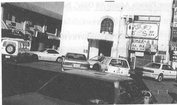
สถานบริการที่หญิงไทยทำงานในญี่ปุ่น (2539)

หลอกลวงคนงานไปทำงานต่างประเทศ ชาวคราวที่บริษัทจัดหางานที่ไม่ได้รับอนุญาตตามกฎหมายหลอกลวงชาวบ้านว่าจะจัดส่งไปทำงานต่างประเทศ ปรากฏเป็นข่าวอยู่เสมอ ข้อมูลล่าสุดของกระทรวงแรงงานและสวัสดิการสังคมระบุว่า ระหว่างเดือนเมษายนถึงกรกฎาคม พ.ศ. 2539 มีคดีหลอกลวงคนงานไปทำงานต่างประเทศเป็นจำนวนมาก ประเทศญี่ปุ่นเป็นประเทศปลายทางที่ถูกบริษัทและนายหน้าจัดหางานนำไปอ้างถึงมากที่สุดและสามารถหลอกเอาเงินจากชาวบ้านได้มากที่สุด กล่าวคือ ช่วงเวลาดังกล่าวมีคนงานถูกหลอกว่าจะไปทำงานในประเทศญี่ปุ่นจำนวน 109 คน จำนวนเงินที่ถูกหลอกสูงถึง 13.17 ล้านบาท ส่วนประเทศอื่นๆ 5 อันดับแรกของคดีดังกล่าวปรากฏในตารางที่ 2