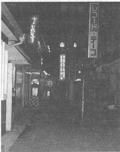
สถานบริการที่หญิงไทย ทำงานในญี่ปุ่น (2539)

ในกรณีของคนงานไทยในประเทศญี่ปุ่นนั้น ข้อมูลปี พ.ศ. 2523 ซึ่งเป็นปีแรกๆ ที่ได้รับรายงานพบว่ามีคนงานไทยทำงานในประเทศญี่ปุ่นอย่างผิดกฎหมายประมาณ 17,884 คน 25 แต่เมื่อเวลาผ่านไป 16 ปี กระทรวงแรงงานและสวัสดิการสังคมรายงานว่าเมื่อต้นปีนี้ (พ.ศ. 2539) “มีแรงงานไทยที่อาศัยอยู่และทำงานในประเทศญี่ปุ่นอย่างผิดกฎหมายมากกว่า 40,000 คน และติดคุกเนื่องจากลักลอบเข้าเมืองผิดกฎหมายและคดีอื่นๆ อีกประมาณ 7,000 คน แรงงานเหล่านี้ส่วนใหญ่ใช้พาสปอร์ตปลอมและวีซ่าหมดอายุ...” 26 อย่างไรก็ตามข้อมูลตัวเลขการเคลื่อนไหวเปลี่ยนแปลงของแรงงานไทยผิดกฎหมายในประเทศญี่ปุ่นระหว่างปี พ.ศ. 2533-2537 สามารถพิจารณาได้จากตารางที่ 1