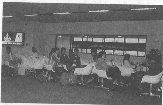
แรงงานข้ามชาติจาก ภาคตะวันออกเฉียงเหนือ ของประเทศไทย ณ สนามบินดอนเมือง ขณะรอเครื่องบินเดินทาง กลับบ้านเกิด ภาพ สุริยา สมทศปต์ (2540)

ก่อนที่จะเดินทางไปยังออสเตรเลีย นอกจากนี้ เบเกอร์ยังนำเสนอด้วยว่าเหตุผลสำคัญที่ผู้หญิงไทยไปค้าประเวณีในออสเตรเลียมี 4 ประการ คือ (1) อาจจะมีรายได้ดีกว่าที่จะหากินในประเทศไทย (2) อาจจะมีโอกาสแต่งงานกับฝรั่ง (3) อาจจะได้มีโอกาสท่องเที่ยวในต่างประเทศ และ (4) อาจจะมีชีวิตความเป็นอยู่ที่สูงสบายกว่าอยู่เมืองไทย แต่ความเป็นจริงแล้ว ความหวังทั้งหมดนี้แทบจะเป็นไปไม่ได้เลย เพราะผู้หญิงไทยเกือบทั้งหมดต้องแบกรับภาระหนี้สิน รวมทั้งค่านายหน้า ค่าเดินทาง ค่าหนังสือเดินทาง ฯลฯ คนละประมาณ 270,000-540,000 บาท ผู้หญิงไทยที่ไปทำงานดังกล่าวจึงถูกบังคับให้ทำงานใช้หนี้ และหลายรายก็ถูกขายต่อไปยังช่องอื่นหรือประเทศอื่นต่อไปอีก