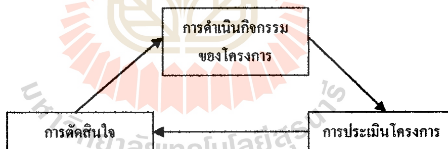
แผนภูมิความคิดพื้นฐานการประเมินของสตัฟเฟิลบีม

การประเมินโครงการใน รูปแบบการประเมินแบบ ชิฟฟ์โมเดล ตามแนวคิดและรูปแบบการประเมินของสตัฟเฟิลบีม (Stufflebeam's CIPP Model) กล่าวว่า “การประเมิน เป็นกระบวนการของการระบุ หรือกำหนดข้อมูลที่ต้องการ รวมทั้งการดำเนินการเก็บรวบรวมข้อมูล และนำข้อมูลมาวิเคราะห์ และสังเคราะห์ให้เกิดสารสนเทศที่มีประโยชน์เพื่อนำเสนอสำหรับใช้เป็นทางเลือกในการตัดสินใจ” โดยมีแนวความคิดพื้นฐาน ดังแผนภูมิความคิดพื้นฐานการประเมินโครงการ