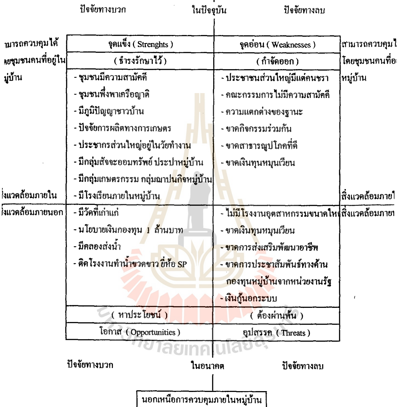
แผนภูมิที่ 3.2 กรอบการวิเคราะห์ SWOT หมู่บ้านหัวสิบ หมู่ที่ 3 ตำบลบ้านใหม่ อำเภอเมือง จังหวัดนครราชสีมา