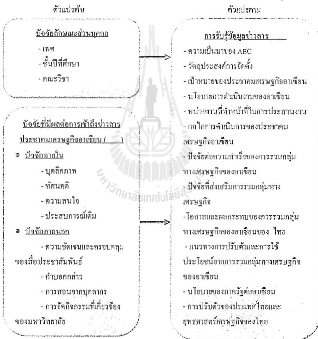
ภาพที่ 2.1 กรอบแนวคิดในการวิจัย

จากการศึกษาค้นคว้าทฤษฎีการรับรู้ และข้อมูลด้านประชาคมเศรษฐกิจอาเซียน รวมถึงงานวิจัยที่เกี่ยวข้อง สามารถนำมาสร้างกรอบแนวคิดในการวิจัย เพื่อศึกษาถึงการรับรู้ข่าวสารประชาคมเศรษฐกิจอาเซียน (AEC) ของนักศึกษาในระดับอุดมศึกษาในประเทศไทย แสดงดังภาพที่ 2.1 ดังนี้