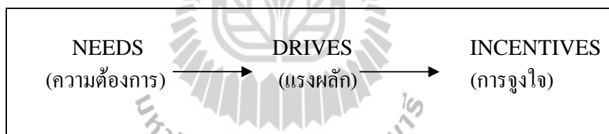
รูปที่ 2.1 ความสัมพันธ์ระหว่าง ความต้องการ แรงผลักดัน สิ่งจูงใจ

Luthans (1995) ได้กล่าวว่า การจูงใจ หมายถึง กระบวนการที่เริ่มต้นจากการที่ร่างกายและจิตใจ มีความต้องการเกิดขึ้นแล้วมีแรงผลักดันทำให้เกิดแรงจูงใจ แล้วทำให้เกิดการกระทำเพื่อนำไปสู่เป้าหมายตามที่ต้องการ ดังแสดงในรูปที่ 2.1