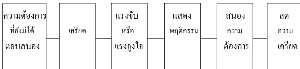
รูปที่ 2.2 แสดงกระบวนการจูงใจ

จะเห็นได้ว่า กระบวนการจูงใจนี้เริ่มต้นด้วย ความต้องการที่ยังมิได้รับการสนองตอบให้เป็นที่พอใจ ถึงแม้ว่าเราจะเข้าใจถึงคำว่า “ความต้องการ” แต่คนเรานั้นจะแสดงพฤติกรรมได้หลายอย่าง สุดแท้แต่ว่าคนนั้นจะรับรู้เกี่ยวกับความต้องการของตัวเองว่าเป็นอย่างไร