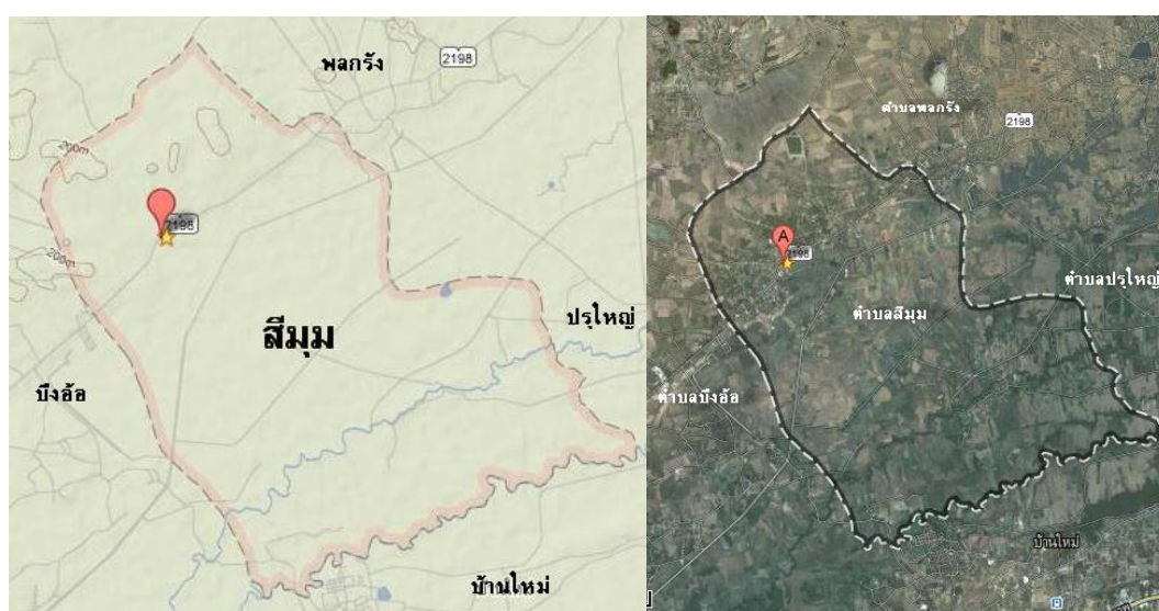
รูปที่ 2.1 แนวเขตการปกครองตำบลสิมม

ทิศตะวันตก ติดต่อกับตำบลขามทะเลสอ และตำบลบึงอ้อ อำเภอขามทะเลสอ จังหวัดนครราชสีมา